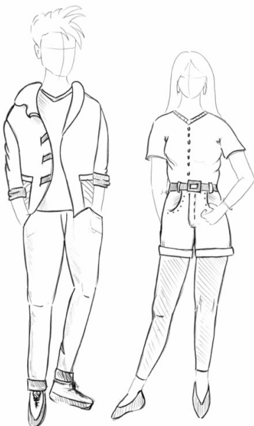
Angemessene Kleidung an unserer Schule