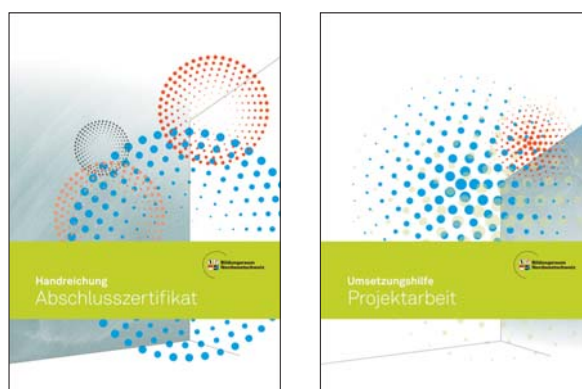
Handreichung Abschlusszertifikat und Umsetzungshilfe Projektarbeit

Für Lehrpersonen und Schulleitungen der Sekundarstufe I 1 bestehen zusätzlich zur Handreichung umfassende Unterstützungsangebote zur Umsetzung des Abschlusszertifikats beziehungsweise der vier Teilzertifikate im Unterricht. Es sind dies die inhaltlichen Referenzrahmen der Checks, die Handreichungen zu den Ergebnismeldungen der Checks, die «Umsetzungshilfe Projektarbeit» inklusive Bewertungsraster und diverser Arbeitsmaterialien wie auch entsprechende Weiterbildungsangebote. Ausführliche Informationen sind zu finden unter www.check-dein-wissen.ch und auf den Internetseiten der vier Kantone des Bildungsraums Nordwestschweiz (siehe Kapitel 4).